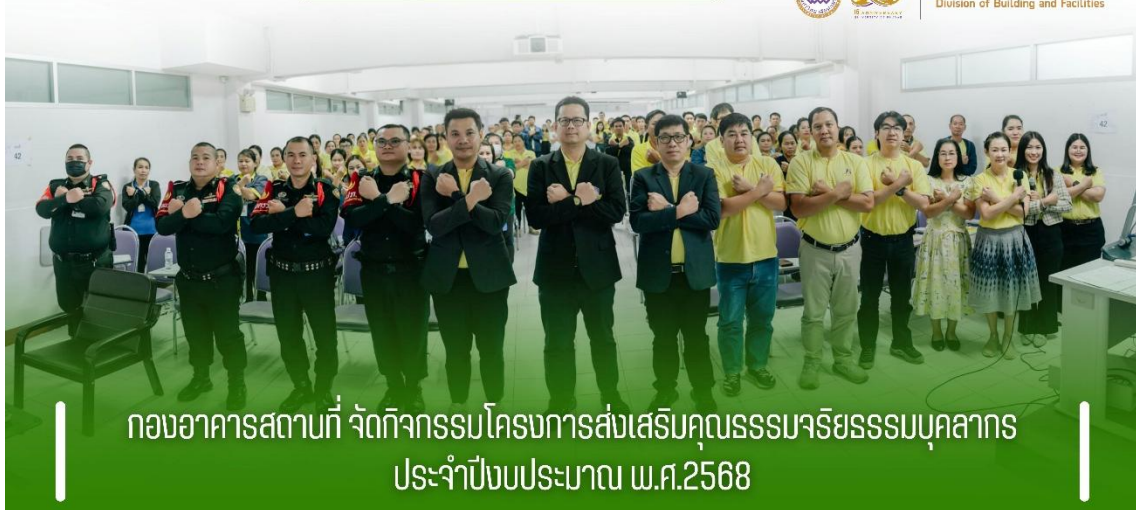
กองอาคารสถานที่ จัดกิจกรรมโครงการส่งเสริมคุณธรรมจริยธรรมบุคลากร ประจำปีงบประมาณ พ.ศ.2568

กองอาคารสถานที่ Division of Building and Facilities